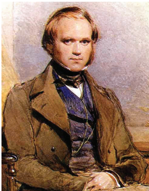
Darwin a la edad de 31 años en 1840 - Acuarela de George Richmond

Se premia a esta persona, a este científico, como una