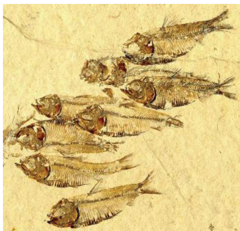
Fósiles de peces sobre piedra

La idea de que la evolución no se da con gradualismo constante, sino con saltos súbitos, tampoco es original de Gould y Eldredge. Como Gould reconoce en uno de sus libros, fue expuesta por Federico Engels (conocido por su colaboración en la redacción de "El Capital" de Carlos Marx) a fines del Siglo XIX, en un ensayo escrito en 1876 que Gould clasifica de "excelente" a la vez que lamenta que no tuvo ningún impacto sobre el pensamiento