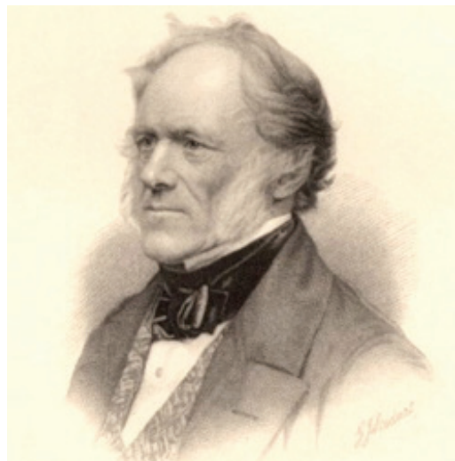
Charles Lyell - Geólogo gradualista

científico occidental. Dicho ensayo se titula: 'El papel del trabajo en la transformación del mono en hombre'.