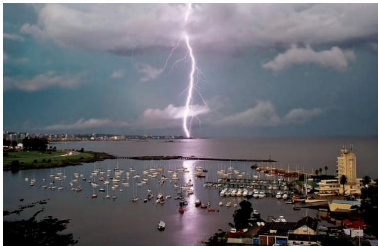
Rayo sobre la costa de Montevideo, Abril 2007.

Existe la esperanza de que con estos cambios, redefiniendo varios aspectos y actuando en necesaria colaboración con la región (los fenómenos meteorológicos no distinguen fronteras políticas) se mejore tanto el trabajo concreto de previsión como la comunicación entre los actores del sistema y hacia afuera del mismo, a la sociedad en general.