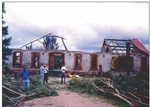
Meteorólogos relevando daños producidos por el tornado ocurrido en Canelones, el 10 de marzo de 2002, en el establecimiento Joanicó.

Si bien la meteorología en Uruguay tiene antecedentes en la Patria Vieja, no fue hasta la fundación del Observatorio del Colegio Pío de Villa Colón en 1882 que se desarrolló con una metodología y un programa científico definido. El Servicio Meteorológico del Uruguay (actual Dirección Nacional de Meteorología: DNM) se fundó en 1895, y en 1905 se creó el Instituto Nacional para la Predicción del Tiempo.