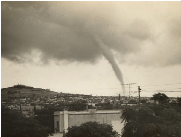
Tromba marina detrás del Cerro de Montevideo. Se estima año 1966.

En el proceso de predicción meteorológica, el especialista analiza los datos de la atmósfera “de partida” a través de distintas variables meteorológicas (particularmente temperatura, humedad, viento). Por eso para emitir cualquier tipo de pronóstico o previsión, se precisan datos. Datos en cantidad adecuada y, especialmente, de calidad adecuada. Datos que servirán también como inicialización de los Modelos de Predicción Numérica del Tiempo (PNT), que tendrán como resultados gráficos donde se muestran simulaciones de la posible evolución de diversos parámetros.