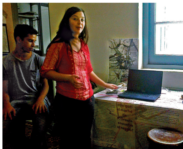
Estudiantes de 2° de Bachillerato Diversificado Ciencias Biológicas, liceo "Los Cerrillos" en Concurso Anual de Introducción a la Investigación (CES), 2014.

Posteriormente, redactaron los resultados y las conclusiones, presentándolos a través de un informe de investigación.