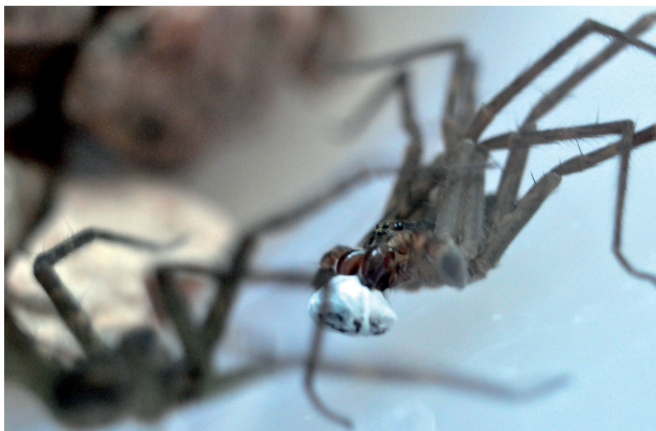
Macho (derecha) ofreciendo regalo nupcial, una presa envuelta en seda, a hembra (izquierda) durante el cortejo. Especie Paratrechalea ornata .

Dentro de las arañas elegimos trabajar con una especie que estuviera bien estudiada y que además presentara comportamientos interesantes para investigar. La especie estudiada fue Paratrechalea ornata perteneciente a la familia Trechaleidae. Es una araña pequeña y semiacuática que se encuentra cerca de cursos de agua en Uruguay. Machos y hembras se pueden identificar por sus órganos copuladores y por la coloración de sus quelíceros (piezas bucales), más rojizos en los machos. Este modelo de estudio tiene una característica única y cautivante: el macho ofrece a la hembra durante el cortejo una presa envuelta en seda, a modo de regalo nupcial (5). Durante el cortejo el macho baila ofreciendo el regalo y la hembra es la que elige si aparearse o no con ese macho. Cuando la hembra muerde el regalo con sus quelíceros significa que aceptó la cópula. Durante la misma, mientras la hembra manipula y come el regalo, el macho transfiere los espermatozoides. Las hembras pueden aparearse varias veces en su vida y luego de varios apareamientos construyen una bolsa de huevos llamada ooteca, la que cuidan y transportan hasta que nacen las arañitas.