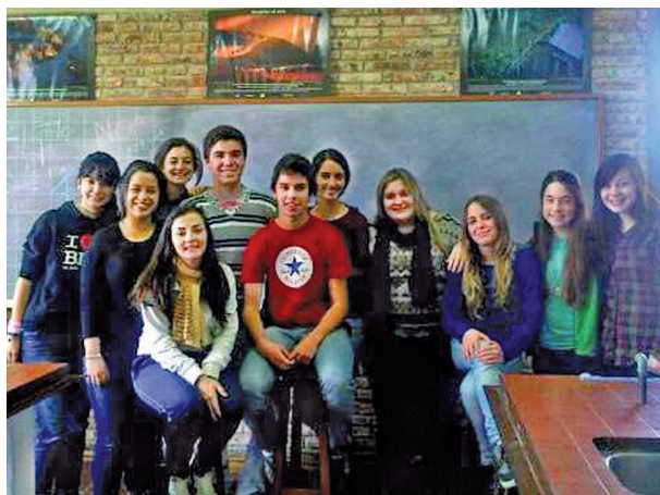
Estudiantes de 2° de Bachillerato Diversificado Ciencias Biológicas en el laboratorio del Liceo Los Cerrillos, Canelones, 2013.

Además, durante el siguiente año 2014, estando los estudiantes cursando 3° BDCB, realizaron exposiciones orales y presentaron su informe en el Concurso Anual de Introducción a la Investigación organizado desde la Inspección del Consejo de Educación Secundaria (CES) quedando seleccionados entre los ocho mejores por los asistentes pares y docentes. Esa instancia fue una parte del proceso de aprendizaje relevante, ya que ellos eran los protagonistas de sus propias investigaciones.